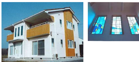
↑ステンドグラスのある家(K様邸 2,600万円)