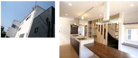
↑家族があっただかになる家(W様邸 2,400万円)