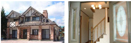
↑ 英国風デザイン住宅(O様邸 2,300万円)