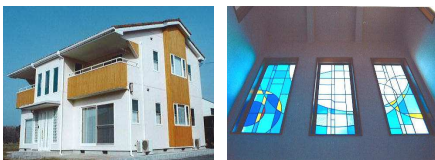
↑ ステンドグラスのある家(K様邸 2,600万円)