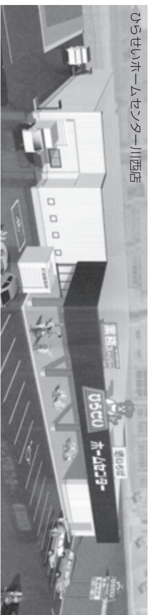
ひらせいホームセンター川西店

大工、園芸用品、グリーン、電器、家庭用品、消耗雑貨、カー用品、カジュアル、ワーク、灯油、文具、時計・メディア、ペット、収納、寝具・インテリア、酒、調味、菓子、飲料、パン、冷食、和日配、洋日配、たばこ、生鮮食品