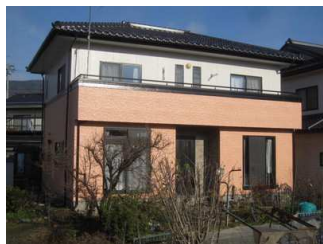
↑ ツートンカラーにイメージ新！