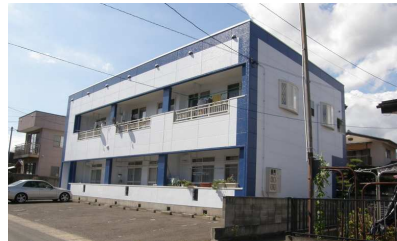
↑ ラインを入れてメリハリつけました。