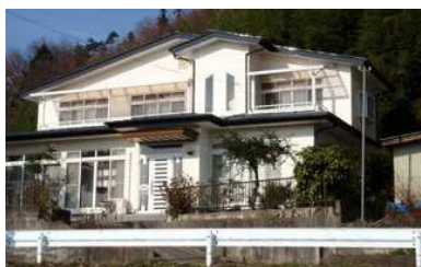
↑ 外観が見違えるようになりました。