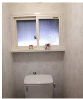
今ある窓の内側にもう一枚